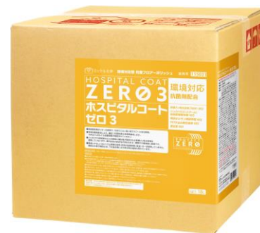
製造元：ミッケル化学株式会社